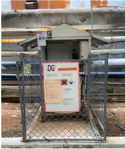
ถังเติมคลอรีนของระบบบำบัดน้ำเสียขั้นต้น ของอาคารโครงการ