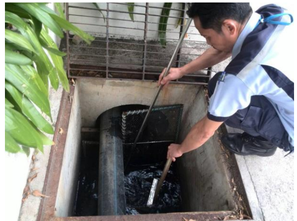
การเก็บตัวอย่างเพื่อตรวจคุณภาพน้ำ Cooling Tower – Legionella